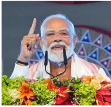
ହିତାଧିକାରୀଙ୍କ ସହିତ ମିଶି କାମ କରିବାକୁ କୁହାଯାଇଛି।

ନୂଆଦିଲ୍ଲୀ, (ଏଜେନ୍ଦ୍ର): ଆମେରିକା-ଇସ୍ରାଏଲର ଲଗାତାର ସହଯୁକ୍ତ କାରଣରୁ ପଶ୍ଚିମ ଏସିଆରେ ସୃଷ୍ଟି ହୋଇଥିବା ସଂଘର୍ଷ ସ୍ଥିତି ଉପରେ ପ୍ରଧାନମନ୍ତ୍ରୀ ନରେନ୍ଦ୍ର ମୋଦୀଙ୍କ ଅଧିକାରୀଙ୍କୁ ରବିବାର ଏକ ଉଚ୍ଚସ୍ତରୀୟ ମିଟିଂ ଅନୁଷ୍ଠିତ ହୋଇଛି। ପ୍ରଧାନମନ୍ତ୍ରୀଙ୍କ ବାସଭବନରେ ଅନୁଷ୍ଠିତ ମିଟିଂରେ ସାଙ୍ଗେ ୩ ଘଣ୍ଟା ଧରି ପେଟ୍ରୋଲିୟମ୍, ଅଗୋଧିଆ ଟେକ୍, ଗ୍ୟାସ୍, ବିଦ୍ୟୁତ୍ ଏବଂ ସାଧାରଣ ଗୃହପୂର୍ଣ୍ଣ କ୍ଷେତ୍ରର ସ୍ଥିତିକୁ ନେଇ ଆଲୋଚନା ହୋଇଛି। ମିଟିଂରେ କେନ୍ଦ୍ର ଗୃହ ମନ୍ତ୍ରୀ ଅମିତ ଶାହ, ଅର୍ଥ ମନ୍ତ୍ରୀ ନିର୍ମଳା ସୀତାରାମଣ, ସ୍ୱାସ୍ଥ୍ୟ ମନ୍ତ୍ରୀ ଜେପି ନନ୍ଦୁ, ପେଟ୍ରୋଲିୟମ୍ ମନ୍ତ୍ରୀ ହରଦୀପ ସିଂହ ପୁରୀ, କୃଷି ମନ୍ତ୍ରୀ ଶିବରାଜ ସିଂହ ଚୌହାନଙ୍କ ସମେତ ବହୁ ମନ୍ତ୍ରୀ ସାମିଲ ଥିଲେ। ଦେଶବାସୀଙ୍କୁ କୌଣସି ପ୍ରକାର ଅସୁବିଧା ନହୁଏ, ସେଥିପାଇଁ ଅତ୍ୟାବଶ୍ୟକ ସାମଗ୍ରୀ ଯୋଗାଣ ଯେପରି ବିନା ବାଧାରେ ଜାରି ରହିବ ତାହା ଉପରେ ମିଟିଂ ଜୋର ଦିଆଯାଇଥିଲା। ମିଟିଂରେ ରାଜ୍ୟ ସରକାରଙ୍କ ସହ ମିଶି କାମ କରିବା ଉପରେ ମିଟିଂରେ ପ୍ରଧାନମନ୍ତ୍ରୀ ମୋଦୀ ଜୋର ଦେଇଥିବା ବେଳେ କଳାବଜାରକୁ ବରଦାସ୍ତ କରାଯିବ ନାହିଁ ବୋଲି କହିଛନ୍ତି। ଏହା ସହିତ ମନ୍ତ୍ରୀ ଏବଂ ଅଧିକାରୀମାନଙ୍କ ଟିମ୍ ଗଠନ କରି ସମନ୍ୱୟ ବୃଦ୍ଧି କରିବାକୁ ନିର୍ଦ୍ଦେଶ ଦେଇଛନ୍ତି। ସମସ୍ତ ସେକ୍ଟରକୁ